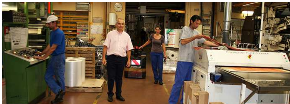
Décomatic, à La Verpillière, compte 10 % de ses salariés en situation de handicap.

Accueil > Solidarité > Mobilisation pour l'emploi